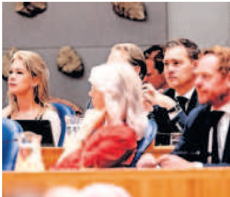
▲ Eelco Heinen, de nieuwe minister van Financiën (tweede van rechts), houdt vast aan de voorgestelde bezuinigingen.

Tijdens het debat over de regeringsverklaring probeerden oppositiepartijen allerlei aangekondigde bezuinigingen van tafel te krijgen. Zo wil het kabinet de btw verhogen op bijvoorbeeld sportscholen, hotels, boeken, kranten en theaters. Ook wil het kabinet het mes zetten in subsidies voor gratis schoolmaaltijden en de maatschappelijke dienst-